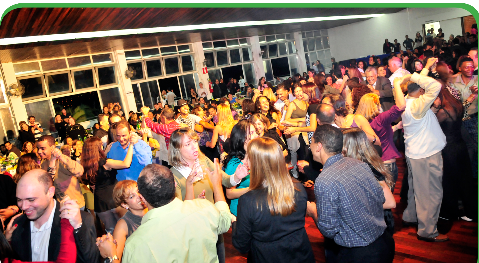
Jantar Dançante 2010

Os ingressos ainda estão à venda e as mesas de quatro lugares poderão ser vendidas na livraria, na recepção e com as pessoas autorizadas, ao preço de R$ 200,00 (duzentos reais), o que inclui o jantar e a sobremesa. Refrigerantes e sucos serão vendidos à parte. Não serão permitidas bebidas alcoólicas. O Grupo aguarda 600 pessoas para o evento.