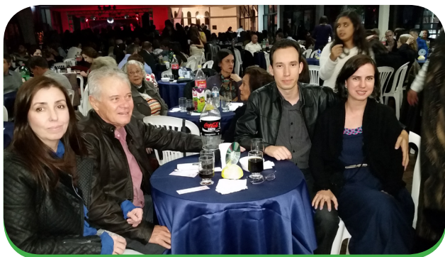
Jantar Dançante 2016

No dia 24 de junho, o tradicional Jantar Dançante do Scheilla vai acontecer em comemoração aos 65 anos de fundação do Grupo. Ele está sendo organizado pela Coordenação de Eventos da Coordenação de Integração Fraterna (FRA), com apoio de várias outras coordenações e da Coordenação Geral (CG) do Grupo Scheilla.