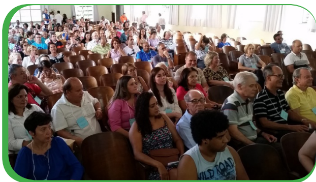
Fraternistas escolhem seus representantes