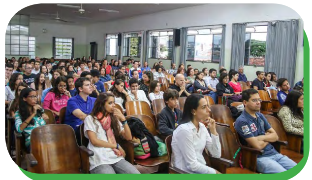
Jovens da Mocidade Espírita Maria João de Deus na Campanha do Quilo