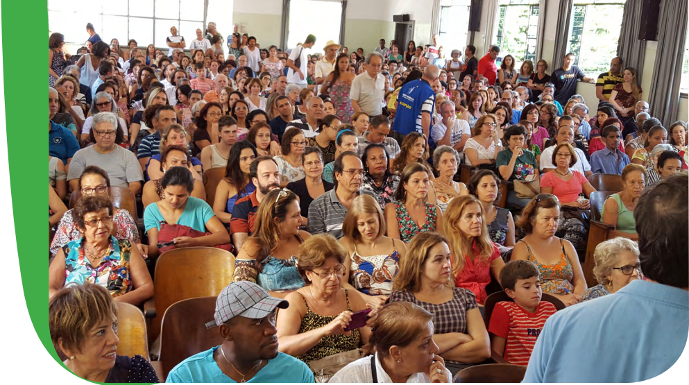
450 participantes assistiram atentos a abordagem