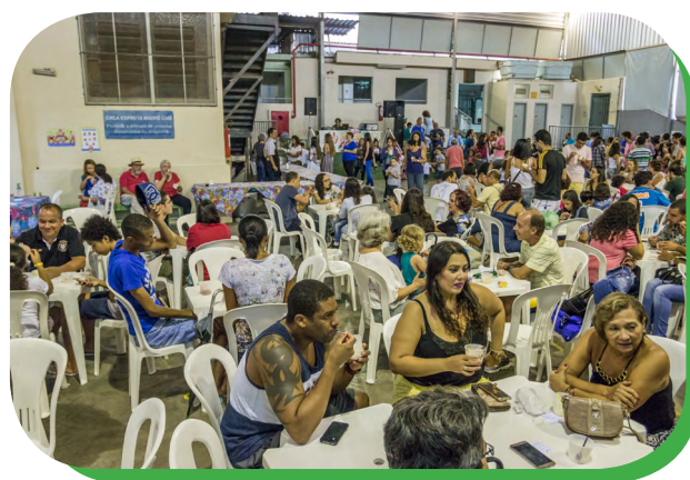
Os participantes do festival saborearam à vontade os diversos sabores de sorvete

no período de 26 a 28/05 e também para pagar a Banda Ricardo Pieroni Banda Show, que animará o Jantar Dançante do Grupo Scheilla, a ser realizado no dia 25/06/2016.