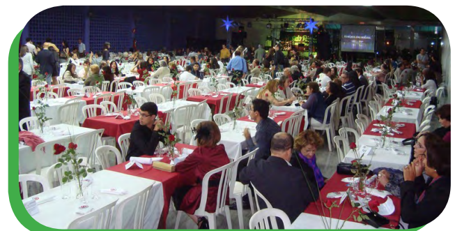
Jantar Dançante: concorrido evento anual