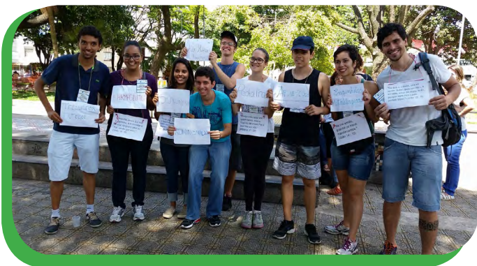
Jovens da Mocidade Espírita Maria João de Deus na Campanha do Quilo