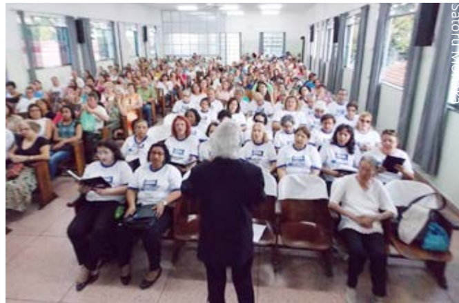
Apresentação do Coral Sebastião Lasneau

Finalizando o evento, todos cantaram o tradicional “Parabéns pra você”, em homenagem aos 23 anos do Coral Sebastião Lasneau.