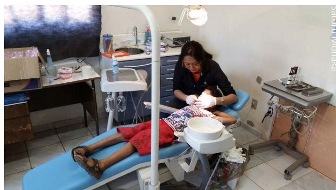
Programa de Saúde Integral Infantil

Ações de Melhoriana Infraestrutura. Foi colocado em funcionamento o poço artesiano perfurado desde 2008 e que estava inconcluso na CIFRATER. O poço colocado em operação abastece reservatório de 15.000 litros. A obra foi realizada com as contribuições de fraternistas da 7ª. Região Fraterna (Mato Grosso do Sul e oeste de