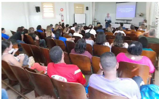
Auditório da CEAL