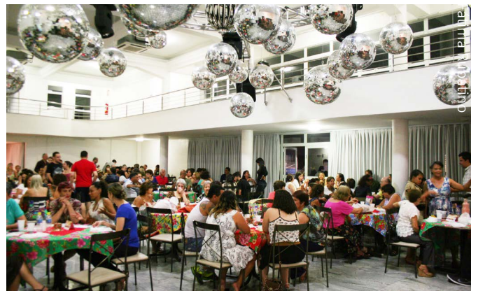
Café com Arte 2015

O evento revela talentos do dia a dia da convivência espírita e oportuniza ocasião de encontro de amigos e familiares. Tudo realizado com trabalho voluntário, doações e altruísmo manifesto