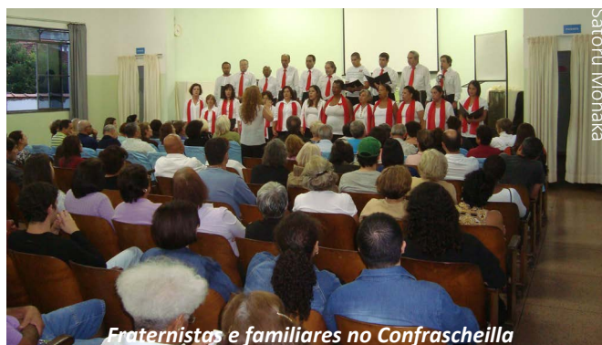
Fraternistas e familiares no Confrascheilla

A reunião foi criada a partir de uma orientação espiritual vinda da própria Irmã Scheilla, que solicitou um dia especial voltado para os tarefeiros da Casa e familiares.