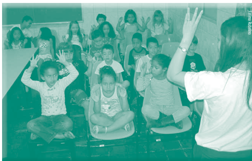
Infância e Juventude: formando hoje o homem de amanhã

Feliz natal e próspero ano novo para todos os amiguinhos!!!!