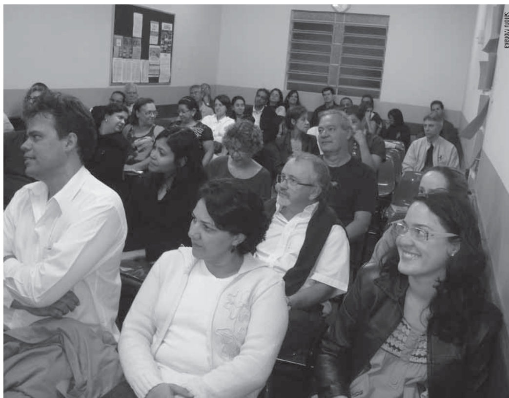
Ciclo de Estudos - Módulo IV

Para se inscrever nos Ciclos de Estudos da Casa é preciso apenas boa vontade e compromisso para com o estudo. As inscrições para o próximo ano serão realizadas no Grupo Scheilla entre os dias 9 e 16 de janeiro de 2012.