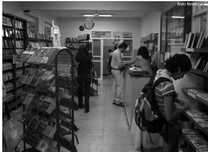
Ganhos de qualidade em novos layout e acesso