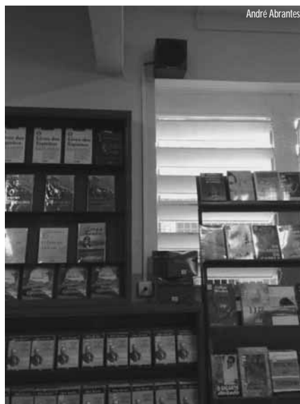
Novo layout da Livraria permite ouvir palestras no salão principal