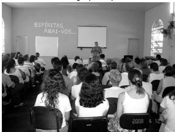
Fraternistas da 4ª e 12ª Regiões no Grupo Irmã Fabíola