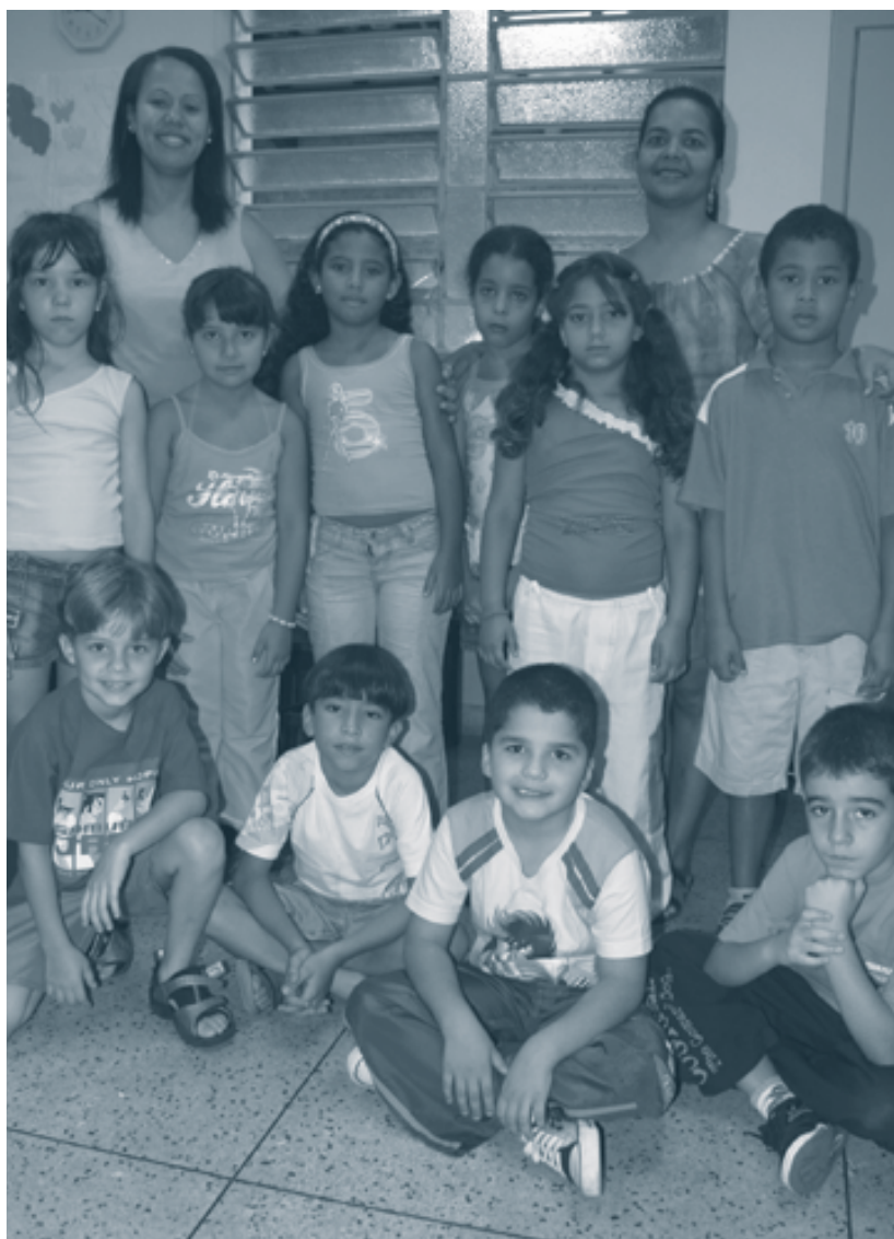
Cerca de 70 tarefeiros ajudam na educação espírita-cristã, através da Evangelização Infantil