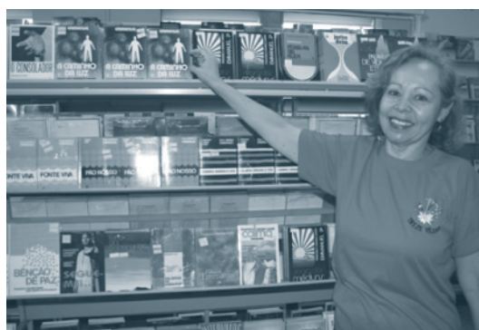
Madalena convida todos à Feira