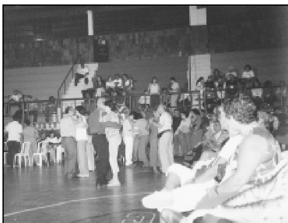
A confraternização entre fraternistas é um dos pontos altos da Semana