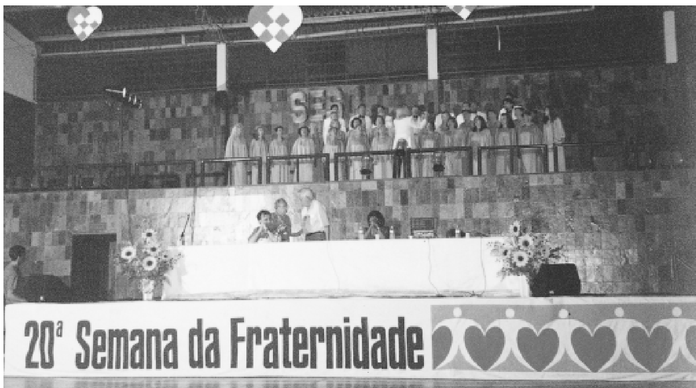
No último encontro a música foi usada para harmonizar o ambiente

A 21ª Semana da Fraternidade, promovida de 24 a 27 de março, além de ser um convite para a vivência do Evangelho, é uma oportunidade de confraternização e de reafirmar nossos compromissos com Jesus e Sua obra na Terra. Página 5