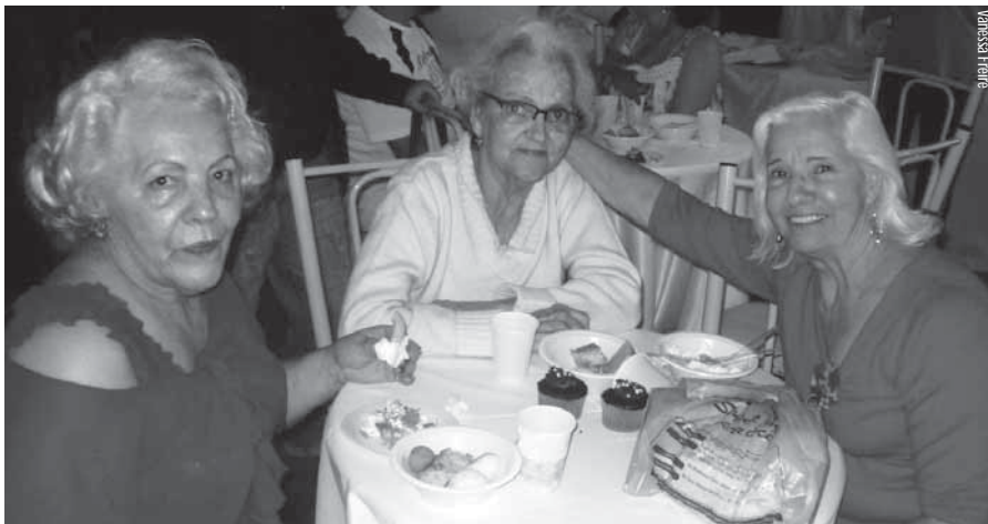
Café com Arte 2010 confraternizando

“Ninguém há que não possa pagar pequena parcela para a realização dessa ou daquela empresa festiva, destinada à sustentação das boas obras.” André Luiz – Sinal Verde