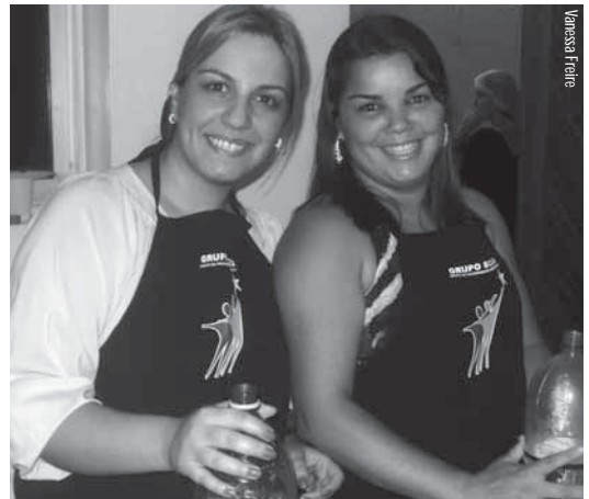
Fraternistas trabalham e se integram durante Café com Arte 2010

Para participar do evento, os fraternistas devem adquirir os ingressos na Livraria ou na Recepção do Centro Oriente, com pessoas autorizadas, pelo valor de R$10,00, a partir da segunda semana de outubro. Crianças até 5 anos não pagam ingresso e de 6 a 10 anos pagam R$5,00. E para aqueles que quiserem se inscrever para enriquecer o