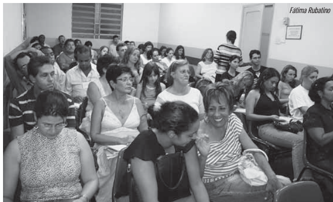
Participantes do Ciclo de Estudos em 2007.

Em 2010, o formato do módulo IV foi reformulado para que o aluno tivesse a